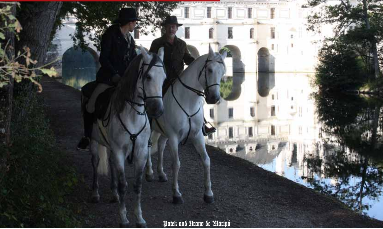
Patek and Urano de Maripá