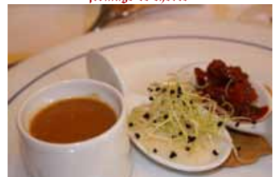
Soup de homard