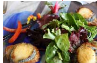
fromage de chèvre