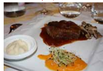
Filet de boef