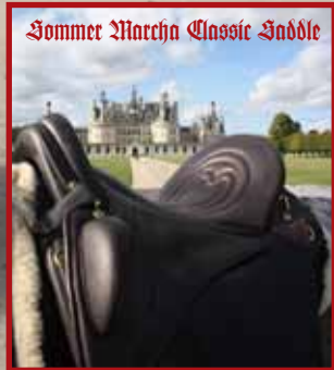
Urano de Maripá

An unserem letzten Tag führte uns die Tour ins Herz der „Sologne“. Nach einem Mittagessen in Villesa- vin ritten wir durch 5.000 ha Schloßwälder zum beeindruckenden, monströsen Château de Chambord mit über 400 Zimmern und 286 Kaminen und Türmchen. Dieses Schloß war der Jagdsitz von König Francois I, der hier mit 12.000 Pferden und 15.000 Personen Gefolge seine Jagden celebrierte.