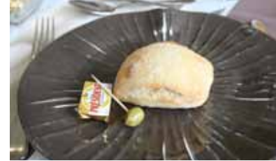
Pain et beurre

Am ersten Tag ging es durch leichtes Gelände zum Privatbesitz „Château de Montpoupon“ mit seinem berühmten „Huntsman Museum“. Hier sind 25 Räume der Geschichte, Ausrüstung und Stallungen der Jagd zu Pferde gewidmet. Danach ging es zum Mittagessen in die „Auberge du Château“. Während dieser Zeit rasteten die Pferde im nahegelegenen Wäldchen bevor die Tour weiter ging.